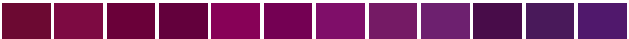
PANTONE 209 PC C:14 M:94 Y:36 K:60 PANTONE 216 PC C:12 M:96 Y:26 K:50 PANTONE 222 PC C:17 M:100 Y:21 K:60 PANTONE 229 PC C:24 M:100 Y:17 K:60 PANTONE 235 PC C:19 M:100 Y:9 K:40 PANTONE 242 PC C:31 M:100 Y:9 K:44 PANTONE 2425 PC C:40 M:100 Y:6 K:27 PANTONE 249 PC C:43 M:95 Y:7 K:32 PANTONE 255 PC C:55 M:96 Y:6 K:25 PANTONE 262 PC C:57 M:92 Y:12 K:56 PANTONE 2622 PC C:65 M:91 Y:9 K:45 PANTONE 2623 PC C:74 M:100 Y:5 K:28