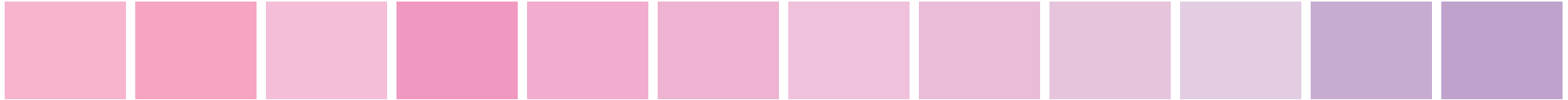
PANTONE 203 PC C:0 M:36 Y:2 K:0 PANTONE 210 PC C:0 M:44 Y:4 K:0 PANTONE 217 PC C:1 M:31 Y:0 K:0 PANTONE 223 PC C:1 M:50 Y:0 K:0 PANTONE 230 PC C:1 M:40 Y:0 K:0 PANTONE 236 PC C:3 M:36 Y:0 K:0 PANTONE 2365 PC C:3 M:29 Y:0 K:0 PANTONE 243 PC C:5 M:30 Y:0 K:0 PANTONE 250 PC C:7 M:26 Y:0 K:0 PANTONE 256 PC C:9 M:20 Y:0 K:0 PANTONE 2562 PC C:20 M:33 Y:0 K:0 PANTONE 2563 PC C:23 M:37 Y:0 K:0