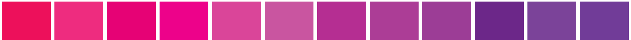
PANTONE 206 PC C:0 M:100 Y:48 K:0 PANTONE 213 PC C:0 M:92 Y:18 K:0 PANTONE Rub. Red PC C:0 M:100 Y:18 K:3 PANTONE 226 PC C:0 M:100 Y:2 K:0 PANTONE Rhod. Red PC C:9 M:87 Y:0 K:0 PANTONE 239 PC C:18 M:80 Y:0 K:0 PANTONE 2395 PC C:29 M:95 Y:0 K:0 PANTONE 246 PC C:34 M:90 Y:0 K:0 PANTONE Purple PC C:43 M:90 Y:0 K:0 PANTONE 259 PC C:69 M:100 Y:1 K:5 PANTONE 2592 PC C:61 M:88 Y:0 K:0 PANTONE 2593 PC C:67 M:91 Y:0 K:0