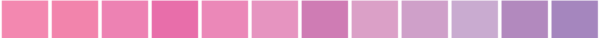
PANTONE 204 PC C:0 M:59 Y:5 K:0 PANTONE 211 PC C:0 M:61 Y:6 K:0 PANTONE 218 PC C:2 M:62 Y:0 K:0 PANTONE 224 PC C:4 M:71 Y:0 K:0 PANTONE 231 PC C:3 M:58 Y:0 K:0 PANTONE 237 PC C:6 M:51 Y:0 K:0 PANTONE 2375 PC C:16 M:61 Y:0 K:0 PANTONE 244 PC C:11 M:43 Y:0 K:0 PANTONE 251 PC C:16 M:41 Y:0 K:0 PANTONE 257 PC C:19 M:34 Y:0 K:0 PANTONE 2572 PC C:30 M:50 Y:0 K:0 PANTONE 2573 PC C:36 M:50 Y:0 K:0